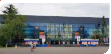
Россия МОЯ ИСТОРИЯ 57 павильон ВДНХ