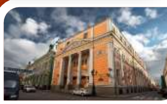
Торгово-промышленная палата Российской Федерации