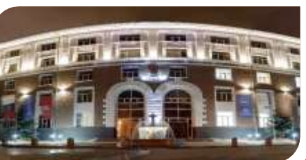
ФГБ ОУ ВО "Российский биотехнологический университет (РОСБИОТЕХ)"