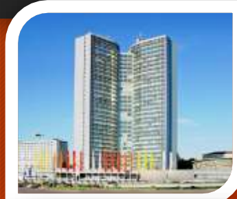
Конгрессно-выставочный комплекс на Новом Арбате