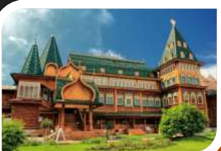
Дворец царя Алексея Михайловича в Коломенском